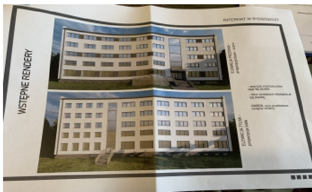
Projekt internatu od zewnątrz

„Jednym z moich marzeń jest stworzenie radiowęzła, dzięki któremu przekaz informacji w szkole byłby znacznie łatwiejszy, a dodatkowo byłby on także pewną formą rozrywki, a także miejscem realizacji uczniów. Jednak największym moim marzeniem jest zbudowanie internatu tylko dla młodzieży z naszej szkoły. Rozmowy prowadzone z Panem Prezydentem naszego Miasta i wstępne projekty budowy zwiastują udane przedsięwzięcie, z którego skorzystałoby wielu naszych uczniów”.