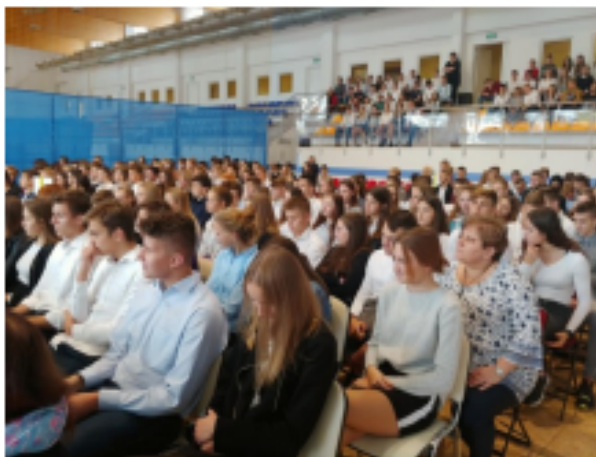
Obchody DEN w XI LOMS

Dzień Edukacji Narodowej upamiętnia rocznicę powstania Komisji Edukacji Narodowej, która została utworzona z inicjatywy króla Stanisława II Augusta Poniatowskiego, a następnie zatwierdzona przez Sejm Rozbiorowy w dniu 14. października 1773 roku. Pierwsze wzmianki o „Dniu Nauczyciela” pojawiły się w 1957 roku. W czasie Światowej Konferencji Nauczycielskiej ustalono, iż Międzynarodowym Dniem Karty Nauczyciela i świętem tej grupy zawodowej będzie 20. listopada. Wprowadzona w życie 27 kwietnia 1972 roku Karta Praw i Obowiązków Nauczyciela ustanowiła nowe święto w kalendarzu rocznym – „Dzień Nauczyciela”, który jest obchodzony w rocznicę powołania Komisji Edukacji Narodowej.