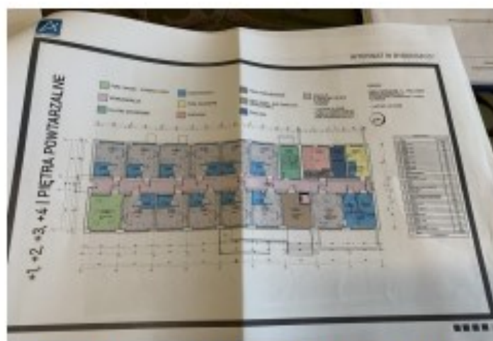
Projekt internatu od wewnątrz