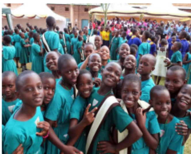
Uczniowie szkoły podstawowej w Ugandzie