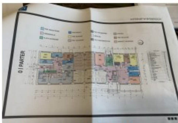
Projekt internatu od wewnątrz

Bardzo dziękujemy za rozmowę: A.O., O.W., F.Rz.