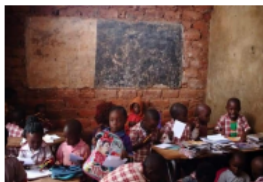
Szkoła podstawowa w Zambii

Szkoły w Zambii nie mogą pochwalić się wysokim poziomem edukacji, aż 26% dzieci w ogóle nie rozpoczyna nauki w szkole podstawowej. Pomimo, że edukacja w klasach 1-7 jest darmowa, to rodzice uważają, że posłanie ich dzieci do szkoły jest niekorzystne dla gospodarstwa domowego. Powodem jest nieprzywiązywanie wagi do wykształcenia dzieci, a istotniejsza jest praca na rzecz rodziny. Szkoły są bardzo oddalone od skupisk ludzkich, niektóre dzieci musiałyby dojeżdżać do szkoły nawet 20km. Na szczęście podejście rodziców zmienia się z i biegiem lat coraz więcej dzieci uczy się.